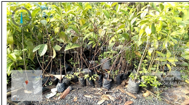
Gambar 1. Foto Bibit Sebelum Ditanam