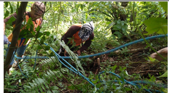
Gambar 4. Foto Proses Penanaman