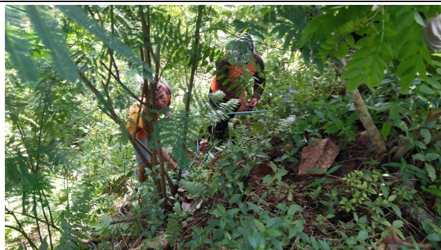
Gambar 5. Foto Proses Penanaman