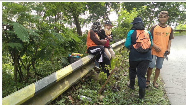
Gambar 3. Foto Menuju Lokasi Penanaman