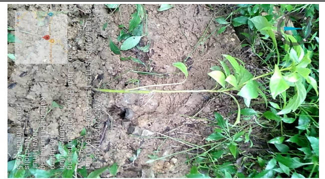
Gambar 6. Foto Bibit Setelah Ditanam