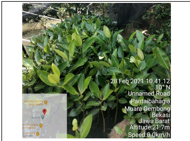
Gambar 1. Foto Bibit Sebelum Ditanam