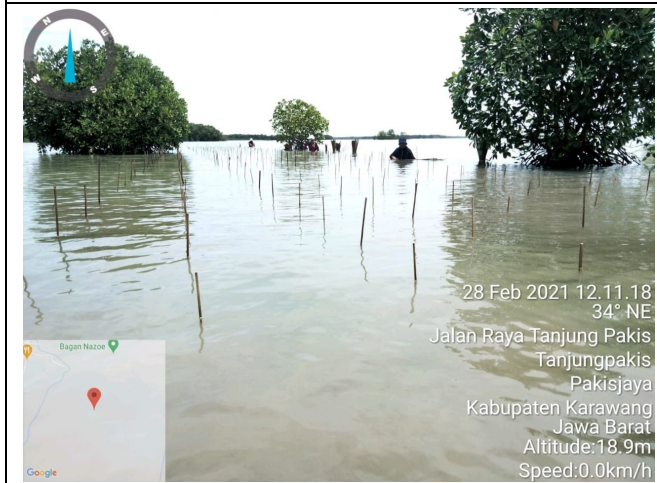
Gambar 3. Foto Proses Penanaman