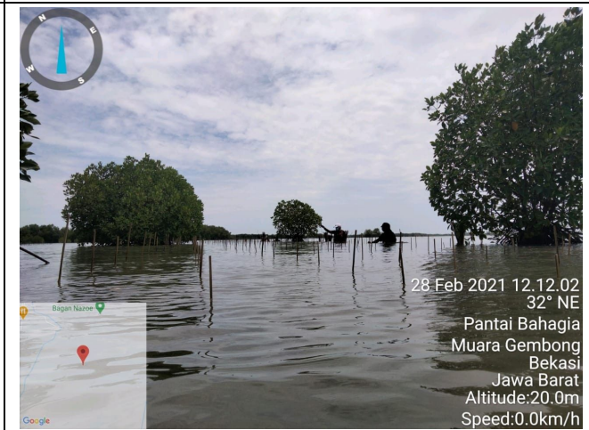
Gambar 4. Foto Proses Penanaman