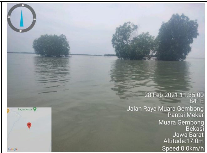
Gambar 2. Foto Lokasi Sebelum Ditanam